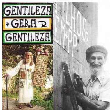
Figura 2. Profeta Gentileza.

Do ponto de vista histórico, um exemplo importante desse tipo de GL, na cidade do Rio de Janeiro são os escritos do Profeta Gentileza (Figura 2), que nas suas errâncias ganhou destaque, transformando uma série de muros cinzas a céu aberto, em poesia, com frases e mensagens de amorização, que são ícones da cidade – “Gentileza Gera Gentileza”. Sua ação artística influenciou a vida e o cotidiano dos cidadãos nos anos 80, fazendo circular pelo espaço urbano, um discurso repleto de significações, sentidos, memória, numa fala heterogênea e simbólica. Gentileza escreveu o conhecido "Livro Urbano", que são mensagens grafadas ao longo das 56 pilastras do viaduto do Caju, na zona portuária do Rio de Janeiro, participando ativamente em um momento importante de abertura política no país (YADO, 2016, p.19).