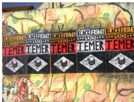
Figura 3. Black Friday Lojas Temer.